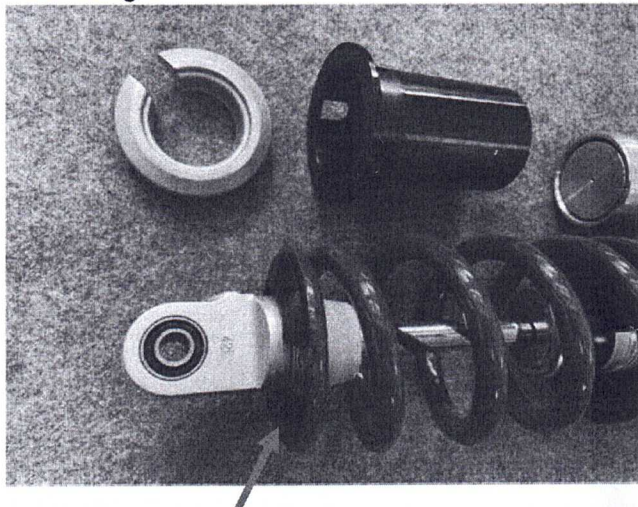
Federbein mit montiertem Federteller